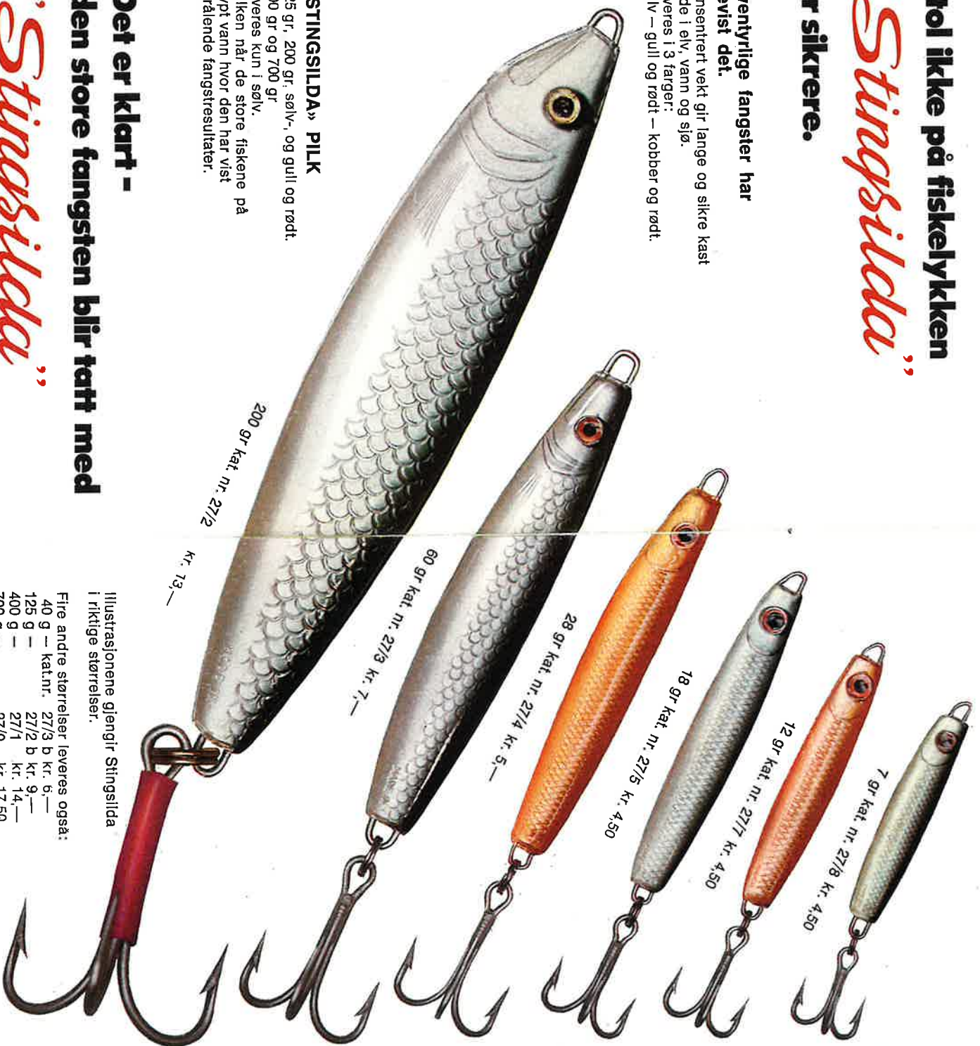
200 gr kat. nr. 27/2 kr. 13,—